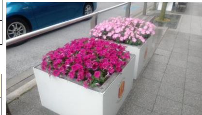
コモスクエア前コンテナ(昨年)