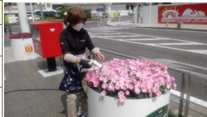
参合館前花飾り(昨年)