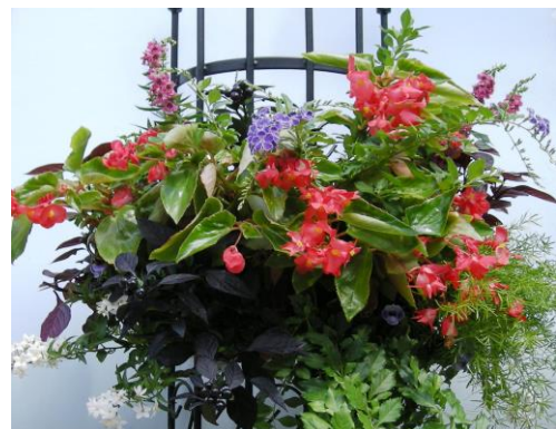
45cmハンギングバスケット(9月)