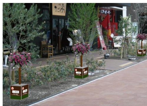
豊田市喜多町キタラ前花かざりイメージ図