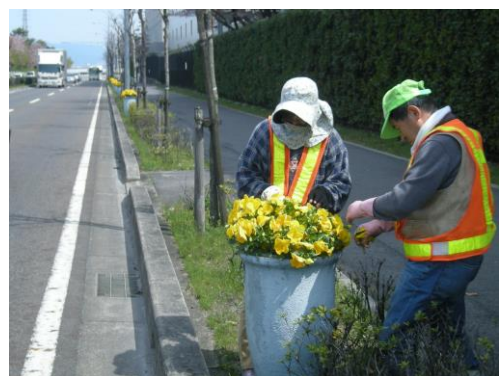
248号線トヨタ町地内(3月)