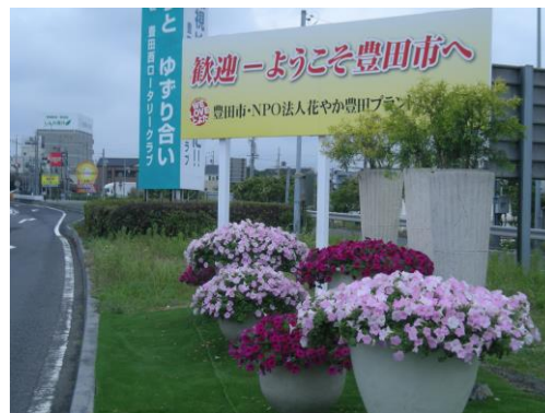
来豊歓迎花かざり豊田IC出口側(6月)