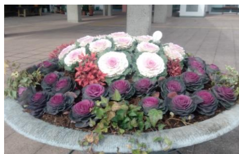
昨年のカバハウス玄関先花かざり