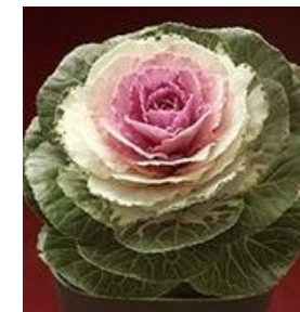
同ファインミックス