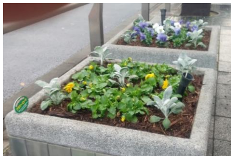
昨年の駅前コモスクエア花かざり