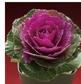
同ファインミックス